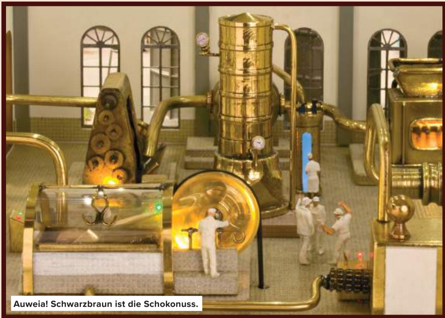
Auwei! Schwarzbraun ist die Schokonuss.

am nächsten Morgen Löcher, groß wie im Schweizer Käse, in den Bauch gefragt wurden. Wer war es? Wer weiß