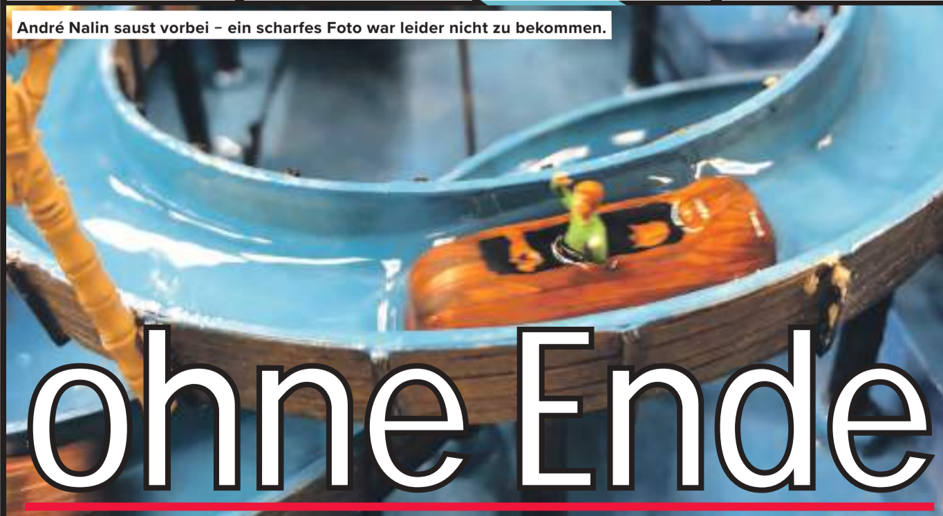
André Nalin saust vorbei – ein scharfes Foto war leider nicht zu bekommen.

mal aus dem nassen Baumstamm ausgestiegen. Trotz Drehwurm, eingeschlafener Beine und einem ausgewachsenen Schnupfen bleibt André Nalin aber erstaunlich gelassen. Fröhlich ruft er den umstehenden Reportern zu: „Es hätte einen schließlich auch schlimmer treffen können.“ Der mitleidige Blick gilt dem armen Tropf in der Schlange vor der Imbissbude gegenüber, der dort seit Eröffnung der Kirmes anstehet und seinem Ziel, einer erlösenden Portion Pommes, einfach nicht näher zu kommen scheint.