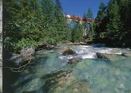
Glacier Express, Bergün-Preda, Graubünden