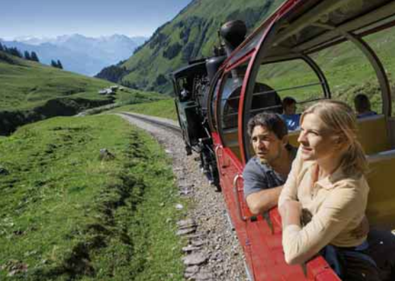
Brienzer Rothorn, Dampfzahnradbahn, Berner Oberland