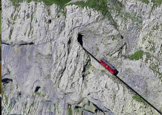
Pilatus, Zahnradbahn, Zentralschweiz