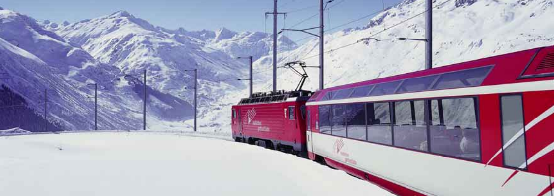
Matterhorn Gotthard Bahn, Oberalppass