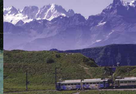
Montreux-Berner Oberland-Bahn, Waadtlaender Alpen